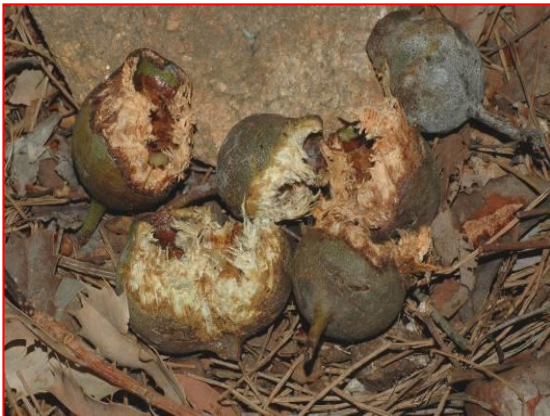
Czarne papugi czerwono-ogonowe